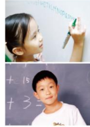
▲圖 1-2-2 有些西方學者研究發現：女性的語言能力發展比男生早，男性的數學能力及空間邏輯能力優於女生。