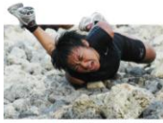
▲圖 1-2-3 破除性別刻板印象，女生也可以透過天竺路，成為女超人