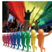
▲圖 1-2-5 尊重多元價值觀是現今重要的人權議題

長期以來，同性戀行為一直被視為病態，直到 1973 年美國心理醫學會才將同性戀從心理診斷手冊上的病態行為項目中刪除，同時指出：過去加諸在同性戀傾向上的負面標籤應該去除。近年來，同志運動日漸發展，且在多元價值觀的倡導下，「同志平權」的觀念也漸被接受。「臺灣同志遊行聯盟」自 2003 年起年年舉辦同志大遊行活動，為亞洲地區最盛大的爭取同志權益活動。2013 年的臺灣同志大遊行，號召來自全臺灣與全球 23 國 6 萬多人齊聚臺北街頭，共同爭取同志的婚姻權與保障，主張正視現行婚姻制度的公平性，以及在制度、文化、社會各方面所造成的性別壓迫與階級壓迫，同性戀者就如同社會中的異性戀者一般，我們應以平常心對待並給予平等的接納。