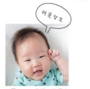
▲圖 1-2-1 你猜！這個小娃兒是男生還是女生？

男性與女性之間除了天生的性別差異之外，也存在著性別角色的差異。性別角色的差異主要是來自後天的學習，性別角色是基於社會文化因素，依據性別來分工並區分責任與義務，期望男性或女性所表現的適當行為，例如：「男主外、女主內」的觀念。當人們習慣了性別角色的差異，便容易造成男女性別角色的刻板印象。