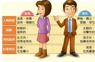
▼圖 1-2-4 性別刻板印象內涵

隨著時代的變遷，傳統性別角色的刻板二分法已經逐漸受到衝擊，現代社會中健康的性格應該擁有「雙性化」特徵，不論男生或女生都可以同時兼具獨立與依賴、堅強與溫柔、主動與被動等兩兼並濟的人格特質；並進一步從性別刻板印象中解放，發展合宜的人格特質，學習適應更多元的現代社會。