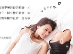
▶圖 1-2-7 建立和諧的性別關係

唯有培養對他人的尊重態度與平等對待的精神，才能建立和諧的性別關係，逐步建立一個平權的社會。同學們，要建立一個性別平等和性別平權的社會，從你我開始，讓我們一起努力吧！